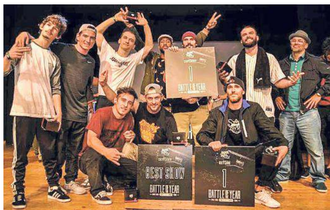
I ballerini triestini del gruppo Illeagles

Il gruppo Illeagles ha rappresentato l'Italia in Germania nella più importante competizione del settore